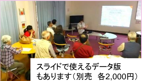
スライドで使えるデータ版 もあります(別売 各2,000円)