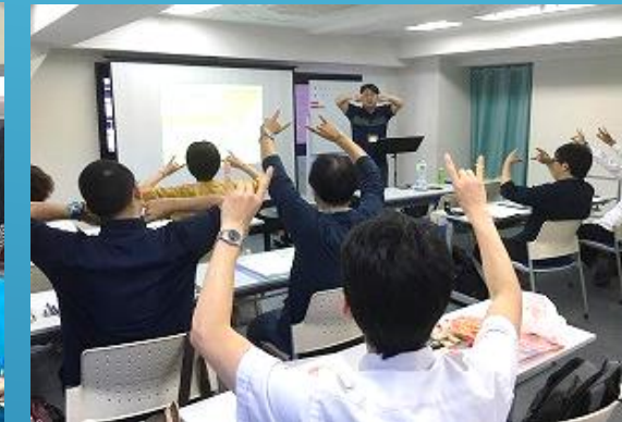
修了者には、認知症セミナー資料（データ）を付与すると共に、きらめき認定トレーナーとして活躍して頂きます。（ただし会員に限る）