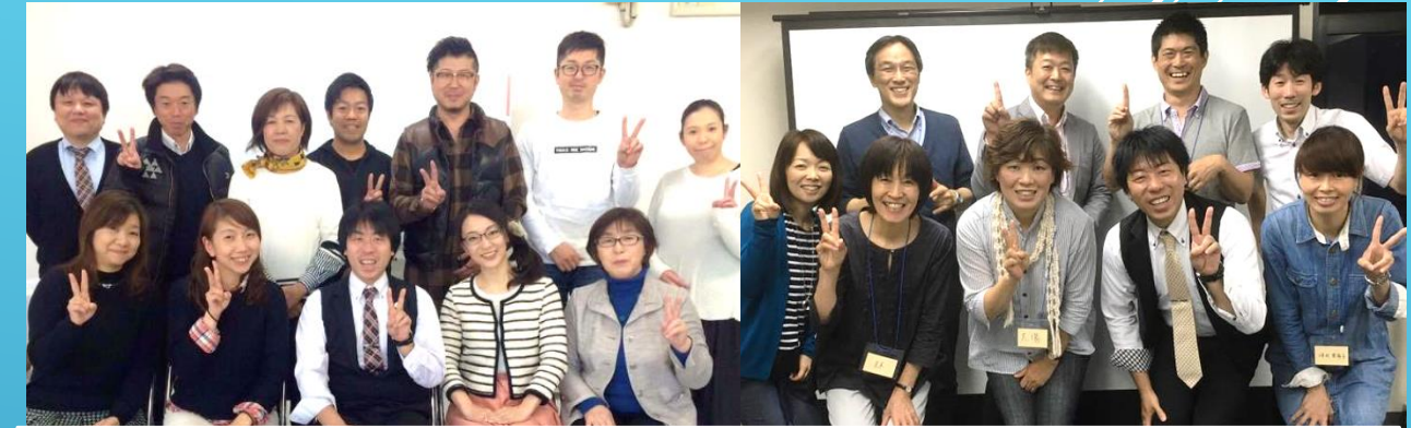
認定トレーナー 全国で560名が活躍中！（受講中・シスター含む）

日本・ハワイで年間300回以上の講演依頼を誇る渡辺哲弘が直伝！！あなたも、私たちと一緒に伝えてみませんか？